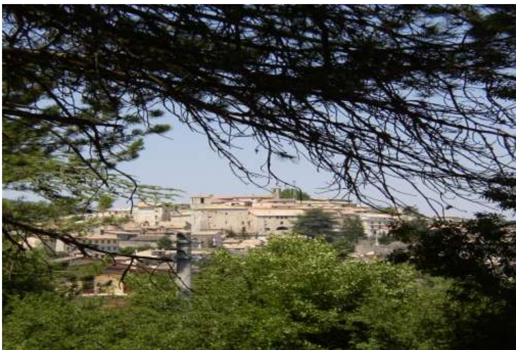
VEDUTA DI MONTELEONE